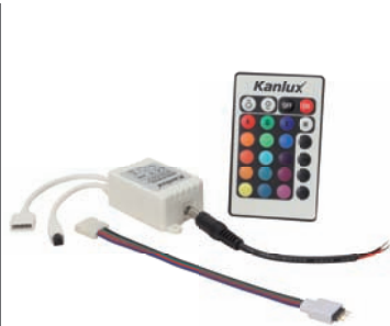
CONTROLLER LED RGB-IR20

Kontroler do liniowych modułów LED RGB / Controller for LED RGB line modules